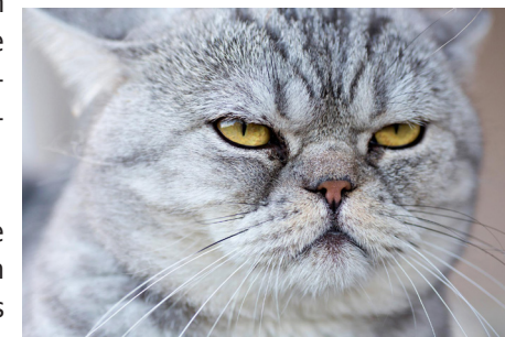
Het moet niet gemakkelijk zijn om overeen te komen met een kat zoals deze.

Vandaag wonen er 80 miljoen katten in de Amerikaanse gezinnen, met een schatting van drie katten voor elke hond op aarde. Nochtans bestaan er nog veel dingen die we niet kennen van onze vrienden katten, zoals in het bijzonder wat ze zoal denken over hun eigenaars.